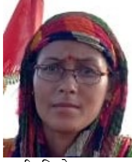
श्रीमति रेणूवाला सचिव